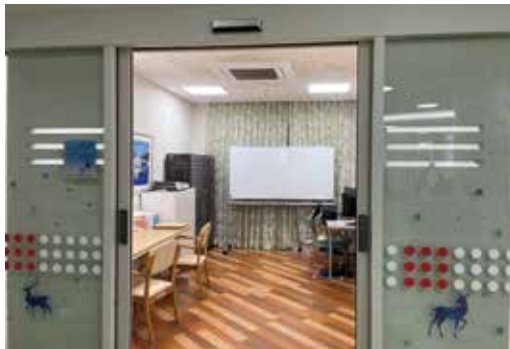
写真1 江東リハビリテーション病院に設けられたジョブトレーニングルーム

担当看護師、担当理学療法士・作業療法士・言語聴覚士、担当医療ソーシャルワーカーと就労支援チームにて就労支援カンファレンスを実施しています（写真2）。退院までの期間で約3回実施しており、身体機能や高次脳機能障害について各専門職の評価を基に今後の支援方針を決定しています。ご家族やご本人の意向も面談時に聴取して反映しています。