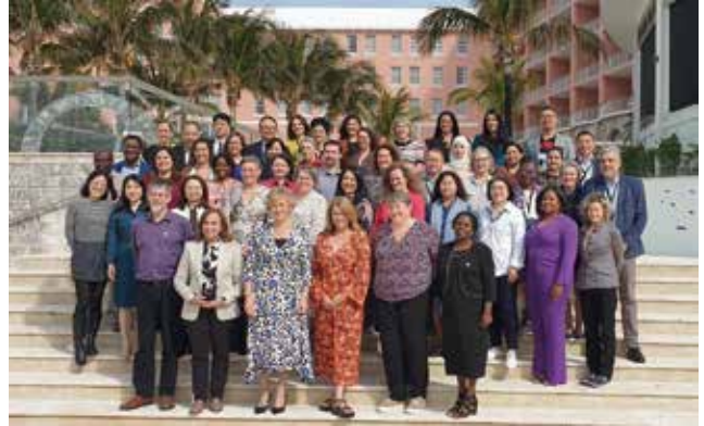
写真2 各国からの代表（集合写真）