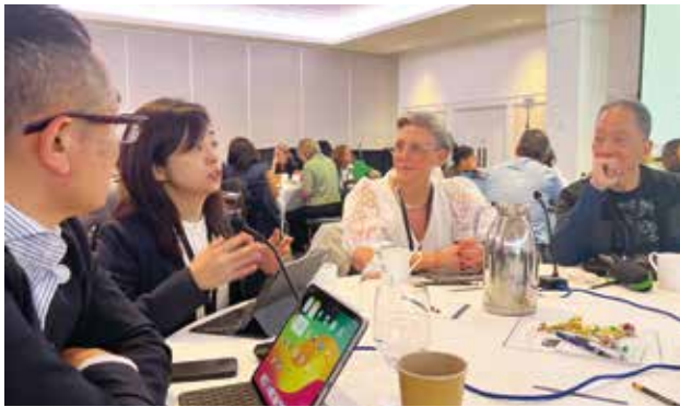
写真3 フォーカスセッションの様子