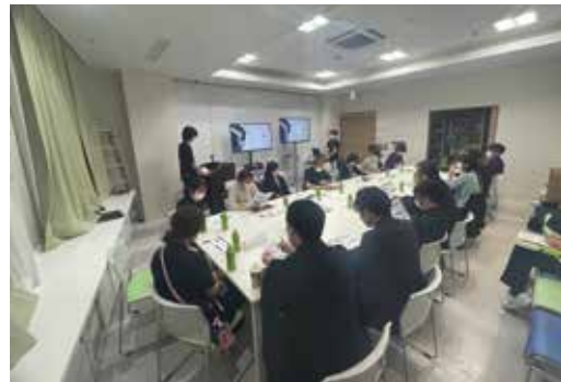
写真2 就労支援症例検討会の様子