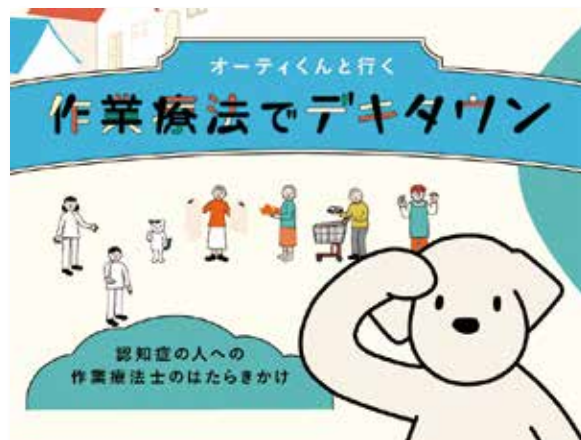
Web コンテンツ「オーティクンと行く作業療法でデキタウン」