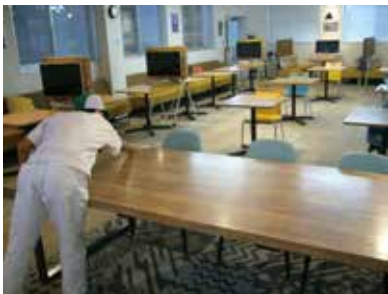
写真3 清掃班の業務の様子

今回、就労支援 OT カンファレンスで紹介したケースは、外部の支援機関の方と家族の協力がなければ問題の解決が難しかったと感じています。社内で自身のできる支援のラインを決めつつ、ラインを超えた際に対象の方を支援してくれる協力者とその役割を自身で理解しておくことの必要性を感じました。