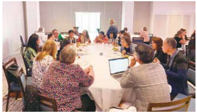
写真4 APOTRG 総会の様子

れました。具体的には、「Client-centered」という表現は患者個々にフォーカスが当てられ、作業療法のソーシャルアプローチに合致しないことや、伝統的なヘルスケア以外の分野で活躍している作業療法士が存在することから、「health」という文言の削除等が提案されました。