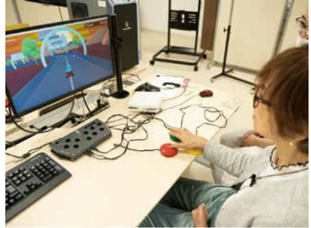
ボタンを使って、片手でもゲームを楽しめます