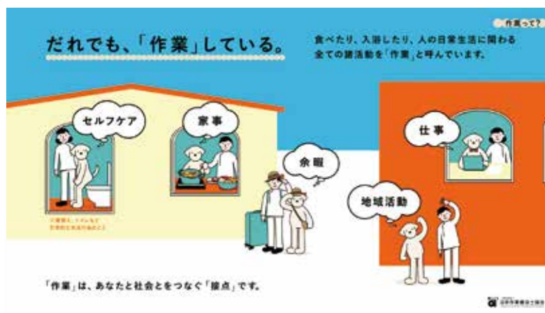
スライド「『作業療法』って？ オーティくん version」