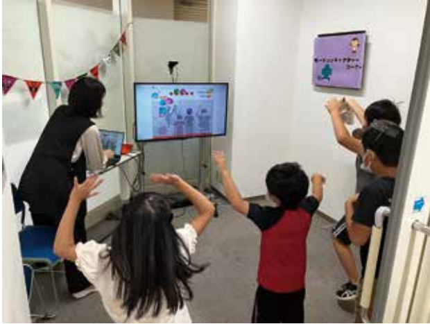
体の動きを使って、みんなでゲーム！