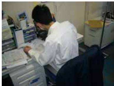
写真4 事務班の業務の様子