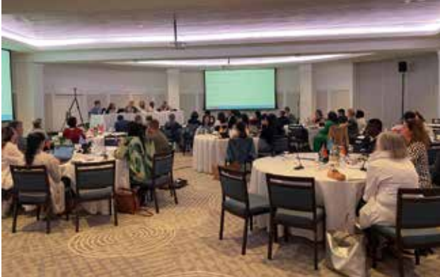
写真1 代表者会議の様子