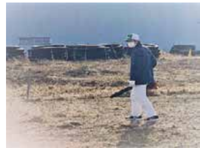
写真5 緑地管理班の業務の様子