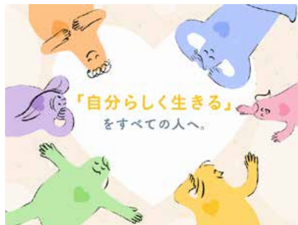
映像「『自分らしく生きる』をすべての人へ。」